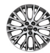
19인치 다이아몬드 커팅 휠