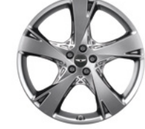
22인치 스퍼터링 휠