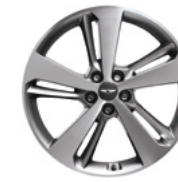
20인치 다이아몬드 커팅 휠