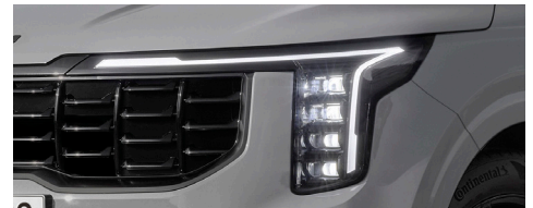
프로젝션 LED 헤드램프, LED 포그램프, 프론트 LED 턴시그널램프