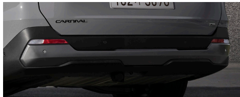
X-Line 전용 엠블럼, X-Line 전용 칼라 (프론트/리어 스키드 플레이트, 라디에이터 그릴 하단 몰딩, 아웃사이드 미러 커버, 루프랙 상단, 도어 하단 몰딩, C필라/테일게이트 가니쉬)