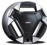
18인치 전면가공 휠 (하이브리드)