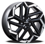
18인치 전면가공 휠 (가솔린)