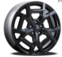
19인치 블랙 휠 (가솔린/하이브리드)