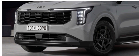
X-Line 전용 블랙 휠, 블랙 라디에이터 그릴, 블랙 엠블럼