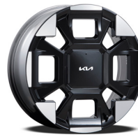
19인치 전면가공 휠 (가솔린/하이브리드)