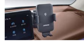
차량용 핸드폰 무선 충전 거치대(흡착형)