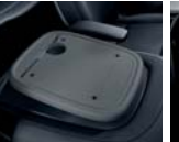
동승석 시트백 보드 트레이 2.0