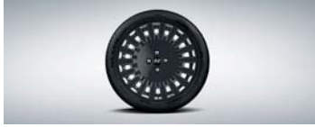
17인치 다크 그레이 알로이 휠