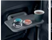
동승석 시트백 보드 테이블 2.0