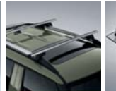
크로스 바 (사이드 어닝 전용)