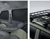
멀티 커튼 (전면/1열/2열)