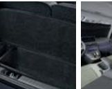
러그지 박스 1.0