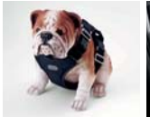
하네스 I (차량용, 소형/중형)