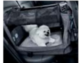
PET 히팅 패드