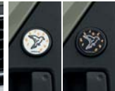
리어 도어 매트