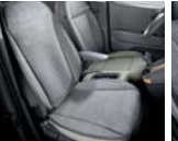
동승석 방오시트커버 (1열)