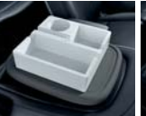
동승석 시트백 보드 트레이 1.0