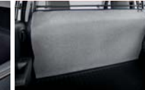
파티션 보드 방오 커버