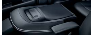
동승석 시트백 보드