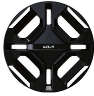
19인치 전면가공 휠 (GT-line 전용)