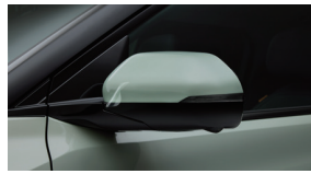
차량 보호 필름