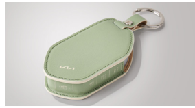
스마트키 가죽 케이스