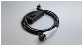
비상용 완속 충전 케이블(220V ICCB)