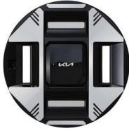
19인치 전면가공 휠