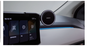
차량용 휴대폰 거치대