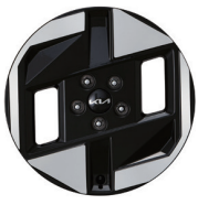
17인치 전면가공 휠