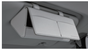
선바이저 선글라스 케이스