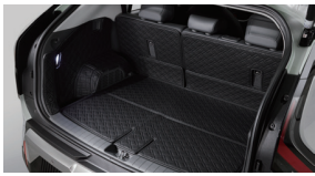
트렁크 풀커버 매트